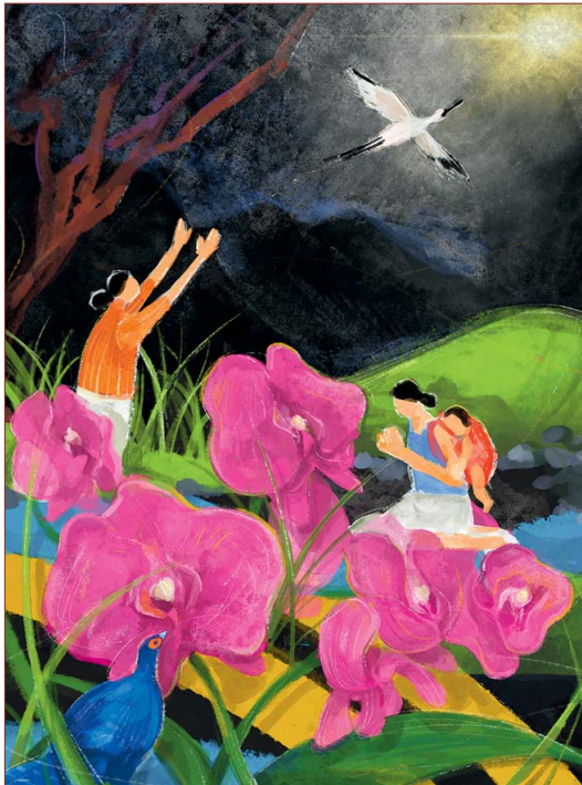
„I Have Heard About Your Faith“ von der taiwanischen Künstlerin Hui-Wen Hsiao

Einflüsse vereint. Zentrum des religiösen Lebens sind die zahlreichen bunten Tempel. Christ*innen machen nur vier bis fünf Prozent der Bevölkerung aus. Über Länder- und Konfessionsgrenzen hinweg engagieren sich Frauen seit über 100 Jahren für den Weltgebetstag. Zum Weltgebetstag rund um den 3. März 2023 laden uns Frauen aus dem kleinen Land Taiwan ein, daran zu glauben, dass wir diese Welt zum Positiven verändern können – egal wie unbedeutend wir erscheinen mögen. Denn: „Glaube bewegt“!