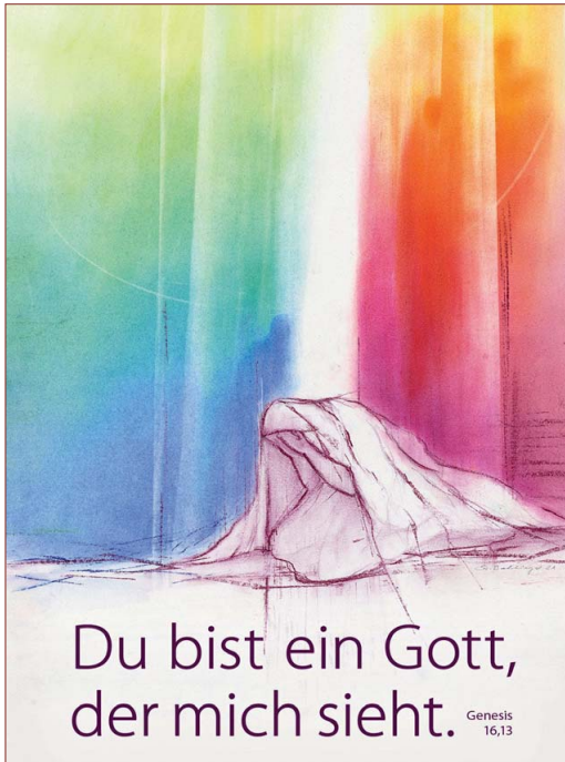
Motiv von Stefanie Bahlinger, Mössingen, www.verlagambirnbach.de

zu der Begegnung. Gott zeigt sich. Er spricht durch seinen Boten, der nicht nur ihren Namen weiß, er fragt auch, warum sie hier ist. Von dieser Begegnung beeindruckt, fragt sie sich, „habe ich wirklich den (hinter dem her-) gesehen, der mich sieht?“. Und als erste in der Bibel gibt sie ihm einen Namen: der Gott, der mich sieht. Die Quelle wird von nun an, Quelle des Lebendigen, der mich sieht, genannt werden. Von Gott gesehen werden, dieser Wunsch entspringt der